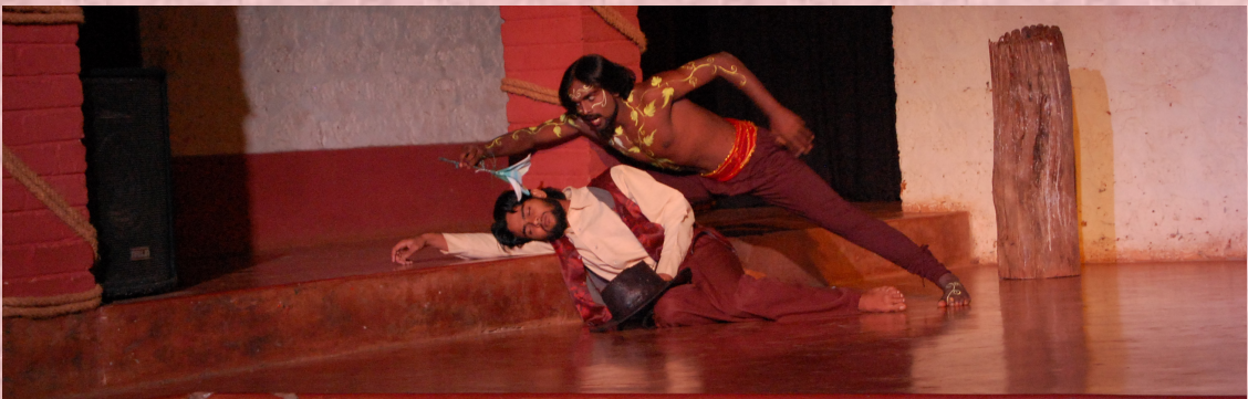
2009-10: ಎ ಮಿಡ್ ಸಮ್‌ರ್ ನೈಟ್ಸ್ ಡ್ರೀಮ್: ನಿರ್ದೇಶನ: ಓಂಕಾರ್ ಕೆ.ಆರ್.

ಬ) ಅಲ್ಲದೆ, ಇಲ್ಲಿನ ರಂಗಶಿಕ್ಷಣ ಡಿಪ್ಲೋಮಾ ಕೋರ್ಸ್ ಎಲ್ಲಾ ರೀತಿಯಲ್ಲೂ ಸಫಲವಾಗುವಂತೆ ಸಹಕರಿಸಿದ ಅತಿಥಿ ಉಪನ್ಯಾಸಕರು, ನಿರ್ದೇಶಕರು, ರಂಗತಜ್ಞರು, ನೀನಾಸಮ್ ಬಳಗದವರು, ರಂಗತಂಡಗಳು ಮತ್ತು ಇತರ ಸಂಸ್ಥೆಗಳಿಗೂ ನೀನಾಸಮ್ ರಂಗಶಿಕ್ಷಣ ಕೇಂದ್ರವು ಋಣಿಯಾಗಿದೆ.