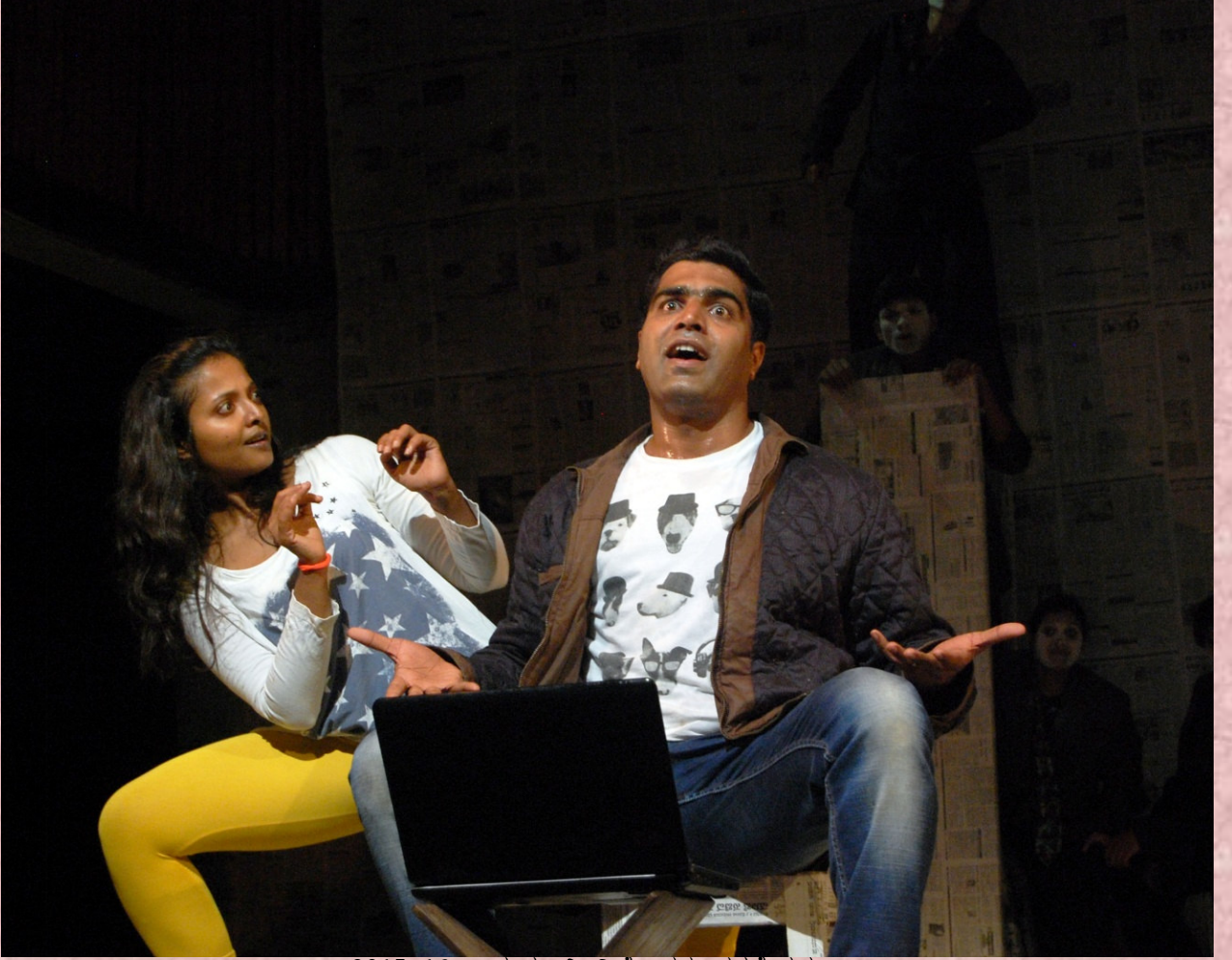
2015-16: ಬಹುಮುಖಿ: ನಿರ್ದೇಶನ: ಚನ್ನಕೇಶವ