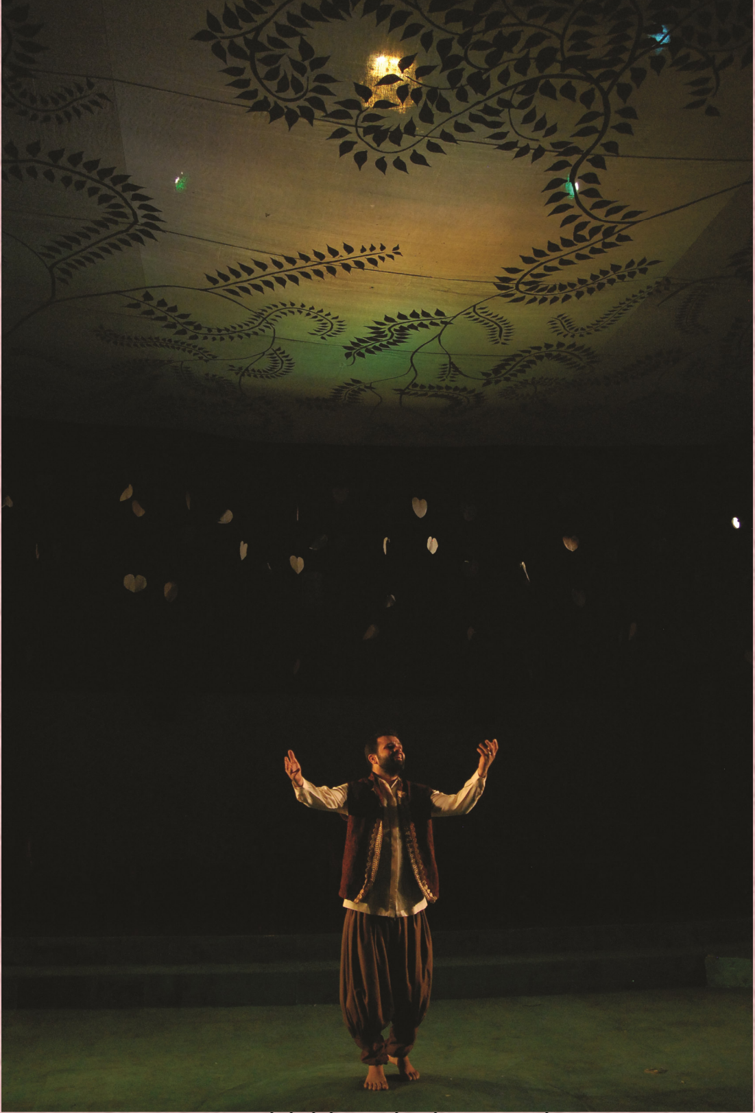
2013-14: ಹೇಗೆ ಬೇಕೋ ಹಾಗೆ: ನಿರ್ದೇಶನ: ಅಕ್ಷರ ಕೆ.ವಿ.

ಬ) ಅಲ್ಲದೆ, ಇಲ್ಲಿನ ರಂಗಶಿಕ್ಷಣ ಡಿಪ್ಲೋಮಾ ಕೋರ್ಸ್ ಎಲ್ಲಾ ರೀತಿಯಲ್ಲೂ ಸಫಲವಾಗುವಂತೆ ಸಹಕರಿಸಿದ ಅತಿಥಿ ಉಪನ್ಯಾಸಕರು, ನಿರ್ದೇಶಕರು, ರಂಗತಜ್ಞರು, ನೀನಾಸಮ್ ಬಳಗದವರು, ರಂಗತಂಡಗಳು ಮತ್ತು ಇತರ ಸಂಸ್ಥೆಗಳಿಗೂ ನೀನಾಸಮ್ ರಂಗಶಿಕ್ಷಣ ಕೇಂದ್ರವು ಋಣಿಯಾಗಿದೆ.