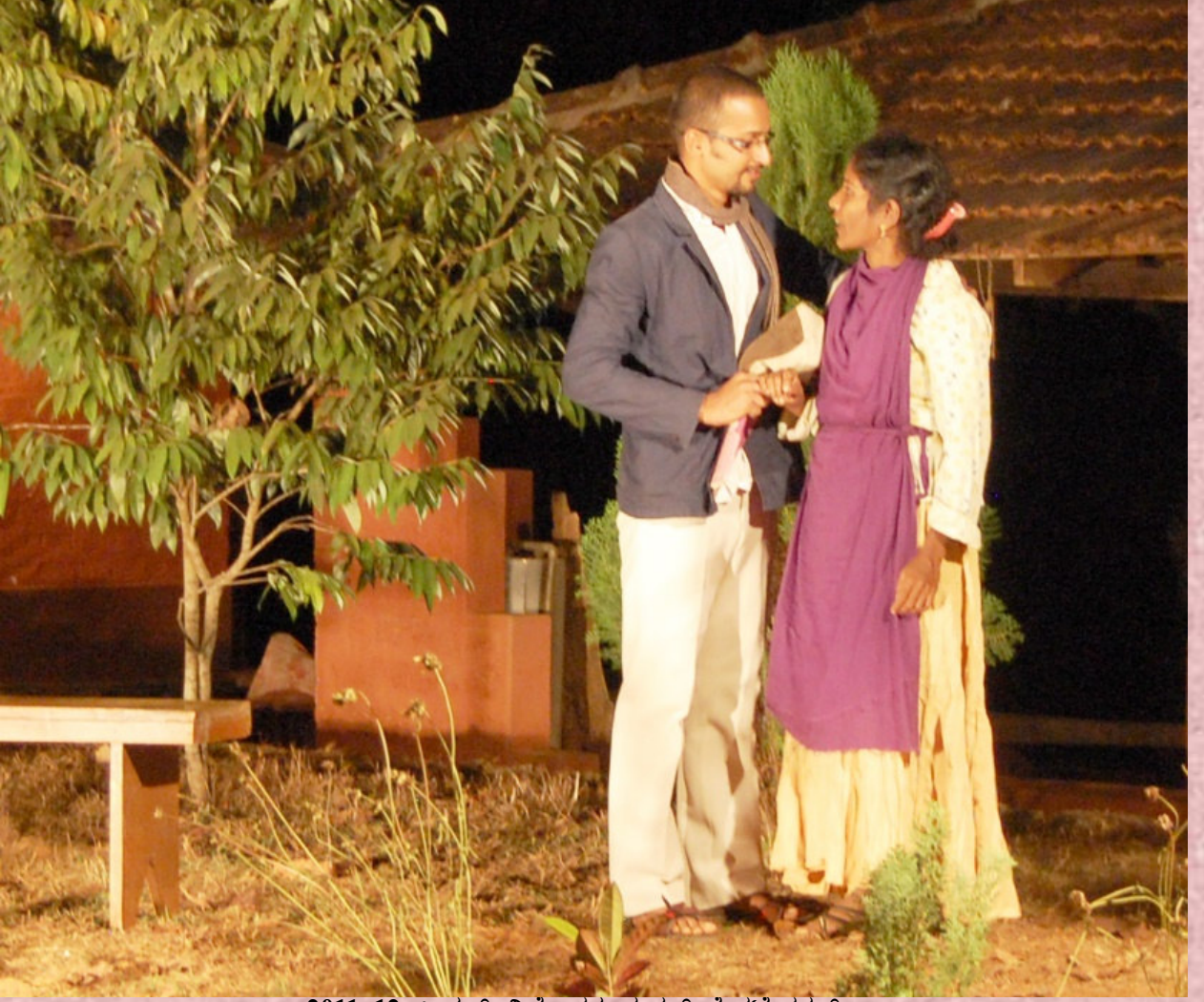
2011-12: ಸೀಗಲ್: ನಿರ್ದೇಶನ: ಶಂಕರ್ ವೆಂಕಟೇಶ್ವರನ್