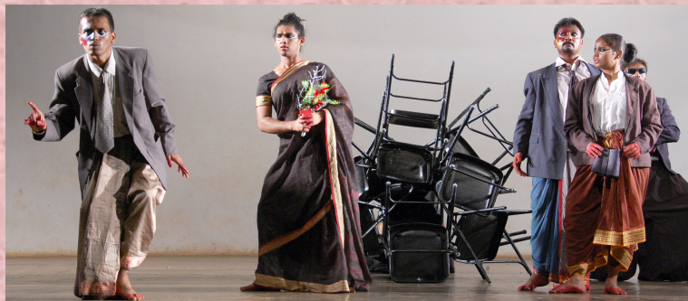
2016-17: ಮೇಜರ್ ಬಾರ್ಬರಾ: ನಿರ್ದೇಶನ: ರಘುನಂದನ ಎಸ್.

ಕಳೆದ ೩೭ ವರ್ಷಗಳಲ್ಲಿ (೧೯೮೦ ರಿಂದ ೨೦೧೭) ಇಲ್ಲಿಅಧ್ಯಯನ ನಡೆಸಿದವಿದ್ಯಾರ್ಥಿಗಳ ಸಂಖ್ಯೆ: ಹುಡುಗರು-೪೩೩, ಹುಡುಗಿಯರು - ೧೬೧ - ಒಟ್ಟು ೫೯೪.