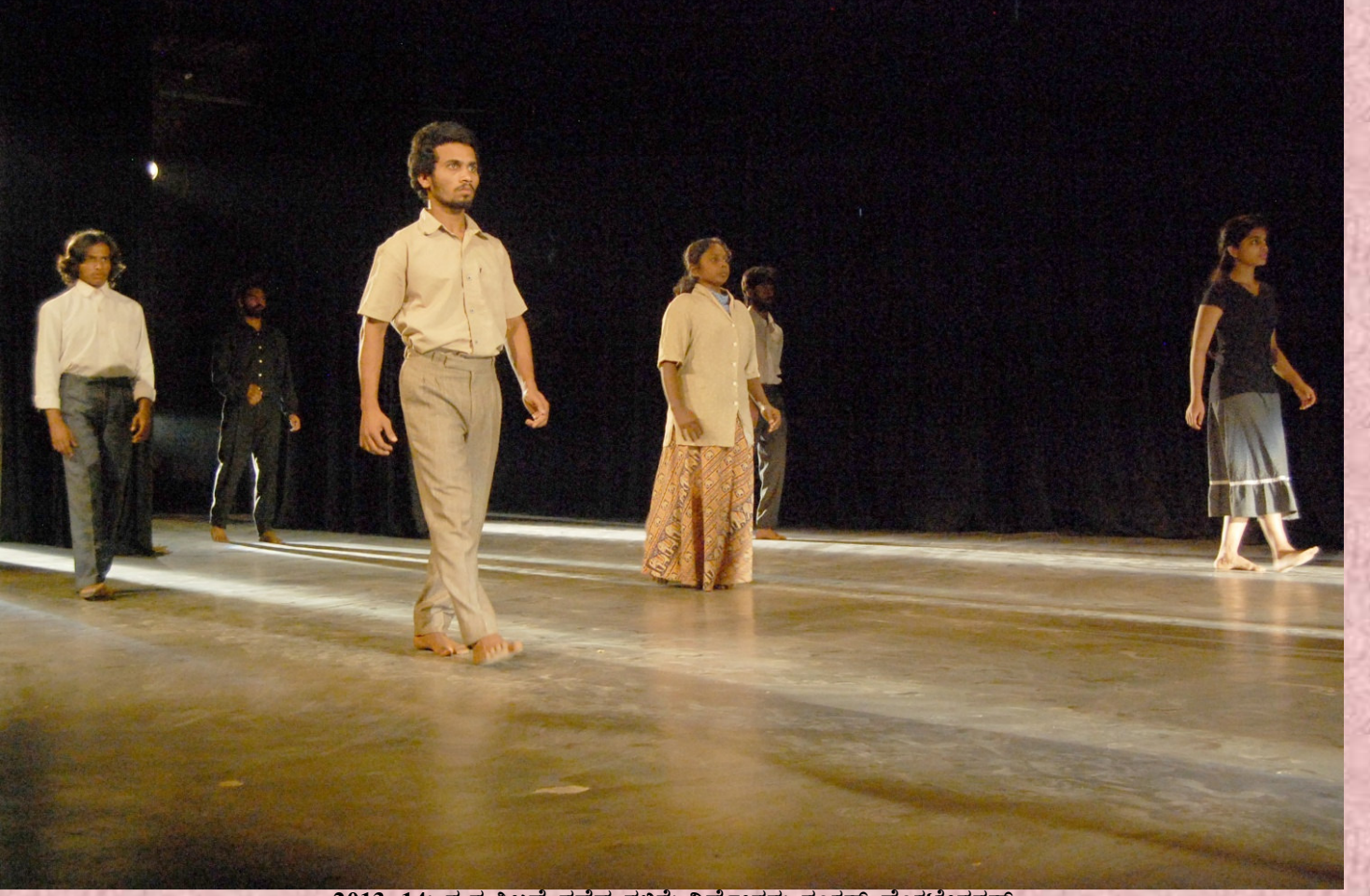
2013-14: ಗುರುತಿಲ್ಲದ ನಡೆದ ಗಳಿಗೆ: ನಿರ್ದೇಶನ: ಶಂಕರ್ ವೆಂಕಟೇಶ್ವರನ್