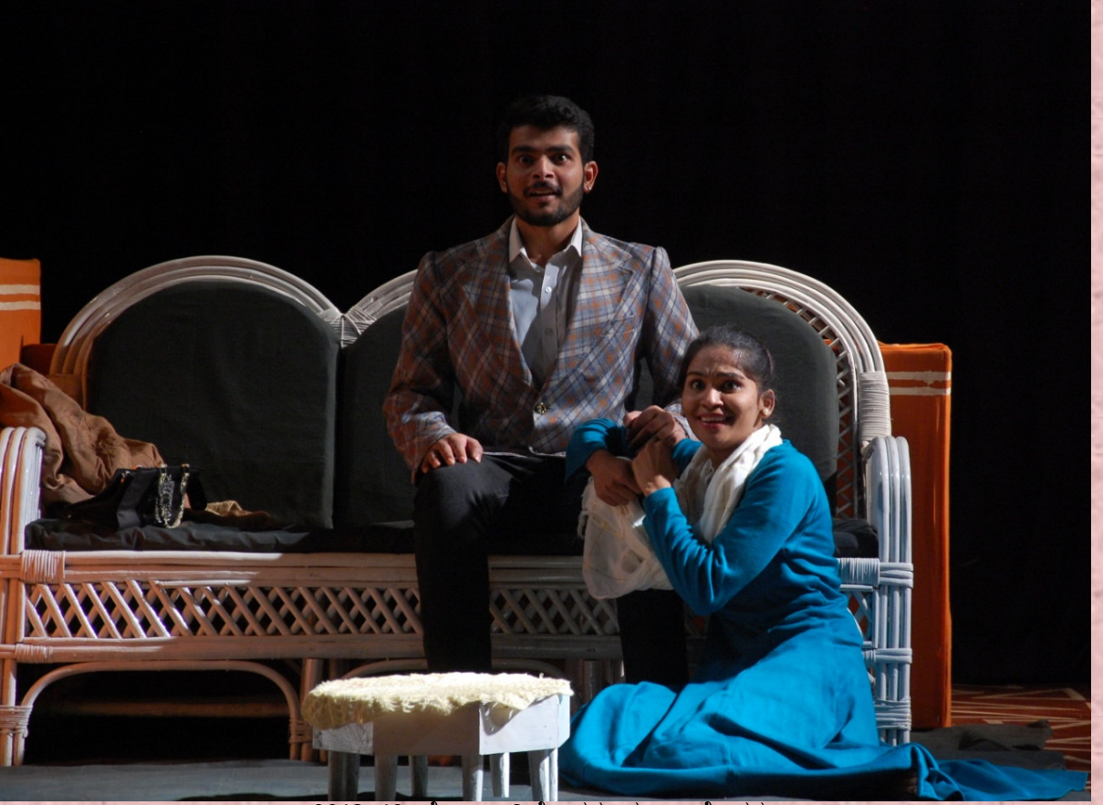
2018-19: ನೋರಾ: ನಿರ್ದೇಶನ: ಮಂಜು ಕೊಡಗು