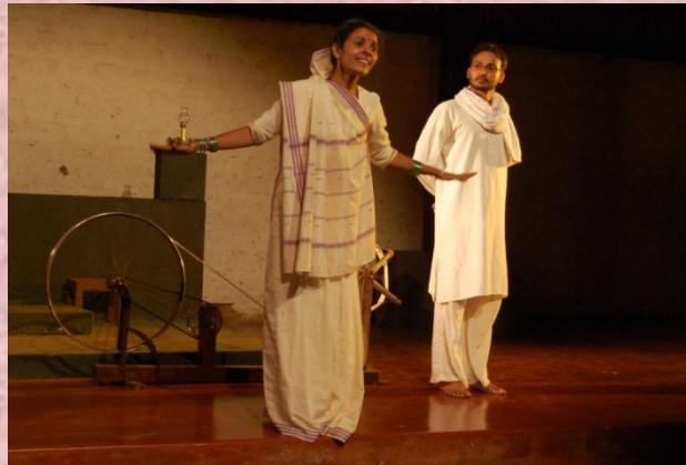
2011-12: ಗಾಂಧಿ ವಿರುದ್ಧ ಗಾಂಧಿ: ನಿರ್ದೇಶನ: ಗಣೇಶ್ ಎಂ.

ಅ) ಕರ್ನಾಟಕ ಸರ್ಕಾರ, ಕನ್ನಡ ಮತ್ತು ಸಂಸ್ಕೃತಿ ಇಲಾಖೆ, ಕರ್ನಾಟಕ ನಾಟಕ ಅಕಾಡೆಮಿ, ಕೇಂದ್ರ ಸಂಗೀತ ನಾಟಕ ಅಕಾಡೆಮಿ - ನವದೆಹಲಿ, ರಾಷ್ಟ್ರೀಯ ನಾಟಕ ಶಾಲೆ - ನವದೆಹಲಿ, ರಾಷ್ಟ್ರೀಯ ನಾಟಕ ಶಾಲೆ - ಪ್ರಾದೇಶಿಕ ಸಂಪನ್ಮೂಲ ಮತ್ತು ಸಂಶೋಧನೆ ಕೇಂದ್ರ, ಬೆಂಗಳೂರು, ಕರ್ನಾಟಕ ಪ್ರೌಢ ಶಿಕ್ಷಣ ಪರೀಕ್ಷಾ ಮಂಡಳಿ, ಬೆಂಗಳೂರು.ಬಿ) ಅಲ್ಲದೆ, ಇಲ್ಲಿನ ರಂಗಶಿಕ್ಷಣ ಡಿಪ್ಲೋಮಾ ಕೋರ್ಸ್ ಎಲ್ಲಾ ರೀತಿಯಲ್ಲೂ ಸಫಲವಾಗುವಂತೆ ಸಹಕರಿಸಿದ ಅತಿಥಿ ಉಪನ್ಯಾಸಕರು, ನಿರ್ದೇಶಕರು, ರಂಗತಜ್ಞರು, ನೀನಾಸಮ್ ಬಳಗದವರು, ರಂಗತಂಡಗಳು ಮತ್ತು ಇತರ ಸಂಸ್ಥೆಗಳಿಗೂ ನೀನಾಸಮ್ ರಂಗಶಿಕ್ಷಣ ಕೇಂದ್ರವು ಋಣಿಯಾಗಿದೆ.