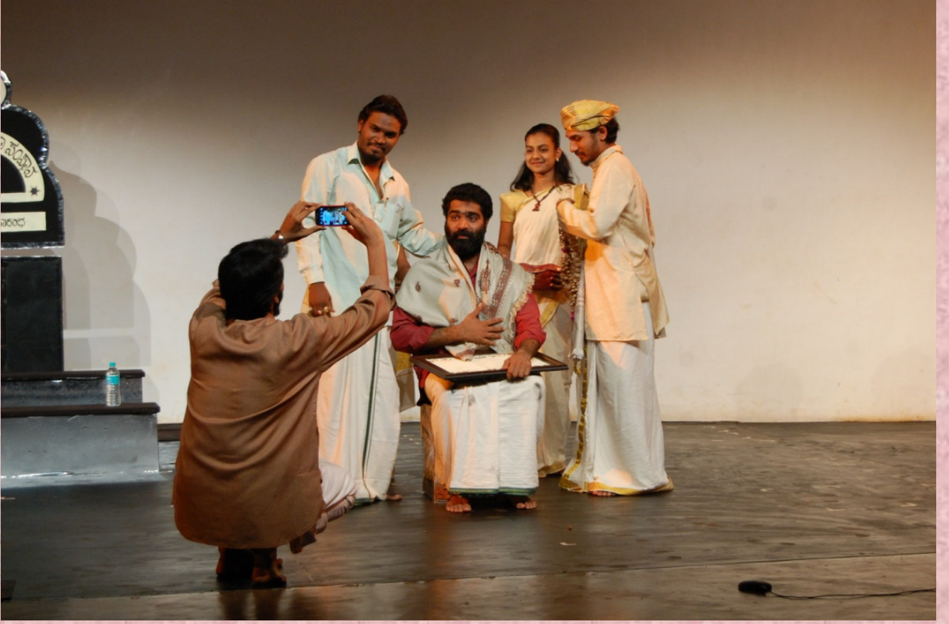
2014-15: ಸೇತುಬಂಧನ: ನಿರ್ದೇಶನ: ಅಕ್ಷರ ಕೆ.ವಿ.