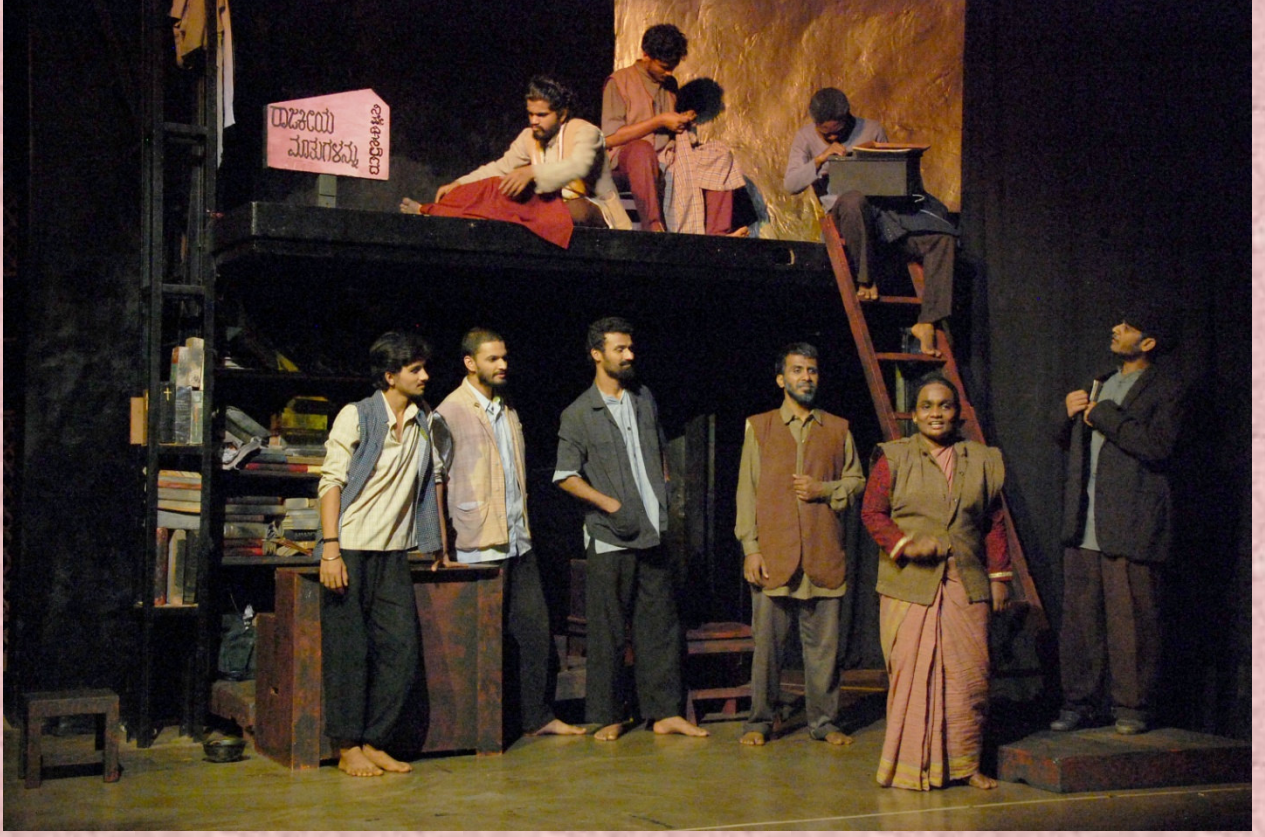
2017-18: ಕರ್ನಾಟಕ ಯಾರೂ ಬರೆಯುವುದೇ ಇಲ್ಲ: ನಿರ್ದೇಶನ: ವೆಂಕಟರಮಣ ಐತಾಳ