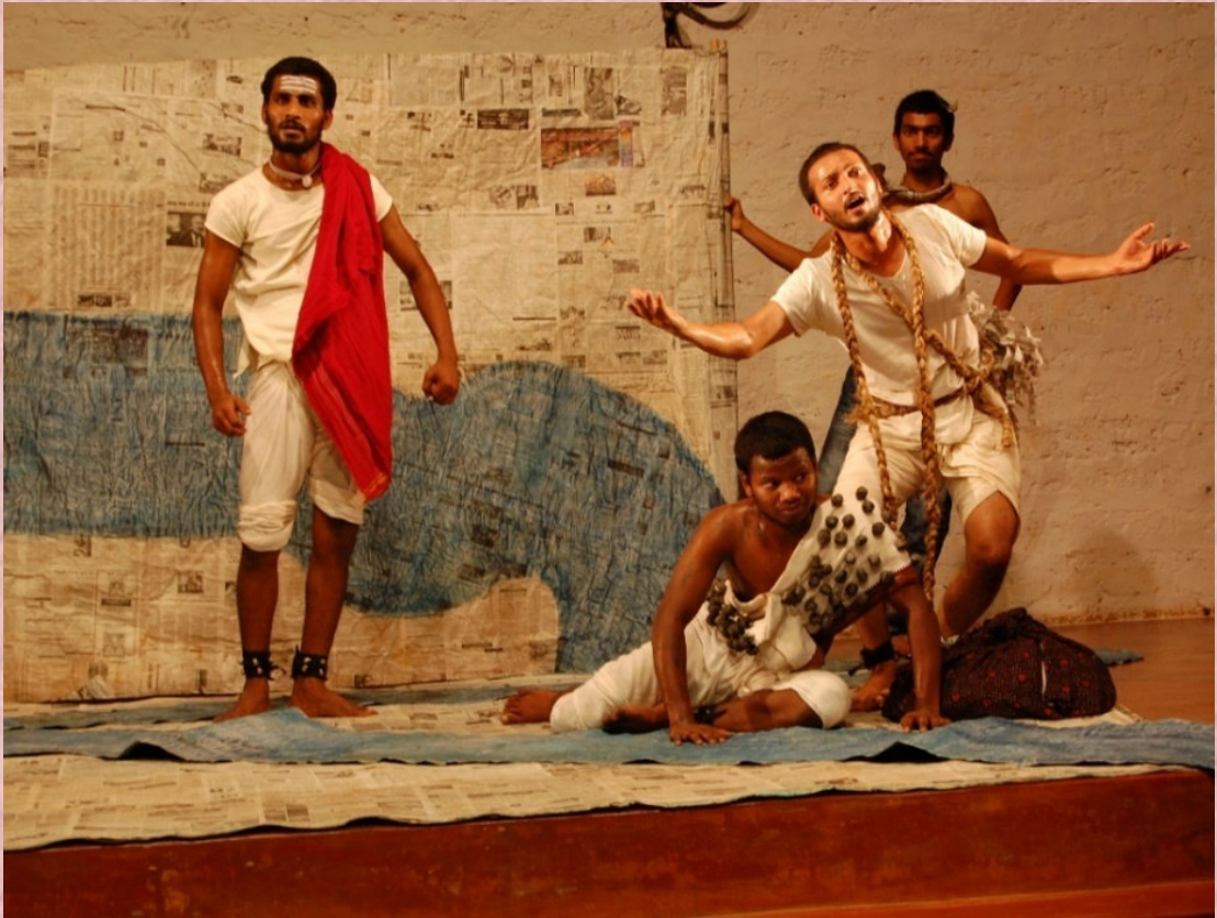
2011-12: ನುಲಿಯ ಚಂದಯ್ಯ...: ನಿರ್ದೇಶನ: ರಘುನಂದನ ಎಸ್.

೧೯೮೦ರಲ್ಲಿ ಪ್ರಾರಂಭವಾದ ಈ ಕೇಂದ್ರ ಮೊದಲ ಎರಡು ವರ್ಷ ಸ್ವಂತ ಆರ್ಥಿಕ ಬಲದ ಮೇಲೆ ನಡೆದಿತ್ತು; ಅನಂತರ ಎರಡು ವರ್ಷ ಕರ್ನಾಟಕ ಸರ್ಕಾರದ ಹಂಗಾಮಿ ಅನುದಾನದೊಂದಿಗೆ ಹಾಗೂ ಆಮೇಲೆ ಖಾಯಂ ಅಂಗೀಕಾರ ಅನುದಾನಗಳೊಂದಿಗೆ ನಡೆದುಕೊಂಡು ಬಂದಿದೆ. ೧೯೯೧ರಿಂದ ರಂಗಶಿಕ್ಷಣ ಕೇಂದ್ರದ ಪರೀಕ್ಷೆಗಳನ್ನು ಕರ್ನಾಟಕ ಪ್ರೌಢಶಿಕ್ಷಣ ಪರೀಕ್ಷಾ ಮಂಡಳಿಯು ನಡೆಸುತ್ತಿದ್ದು ಉತ್ತೀರ್ಣರಾದ ಅಭ್ಯರ್ಥಿಗಳಿಗೆ 'ಡಿಪ್ಲೊಮಾ ಇನ್ ಥಿಯೇಟರ್ ಆರ್ಟ್ಸ್' ಪದವಿಯನ್ನು ನೀಡಲಾಗುತ್ತಿದೆ.