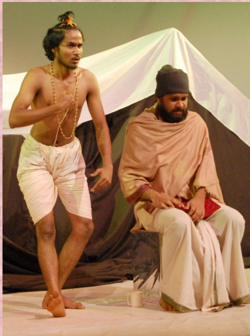
2012-13: ಭಾರತ ಯಾತ್ರೆ: ನಿರ್ದೇಶನ: ಅಕ್ಷರ ಕೆ.ವಿ.

ಬ) ಅಲ್ಲದೆ, ಇಲ್ಲಿನ ರಂಗಶಿಕ್ಷಣ ಡಿಪ್ಲೋಮಾ ಕೋರ್ಸ್ ಎಲ್ಲಾ ರೀತಿಯಲ್ಲೂ ಸಫಲವಾಗುವಂತೆ ಸಹಕರಿಸಿದ ಅತಿಥಿ ಉಪನ್ಯಾಸಕರು, ನಿರ್ದೇಶಕರು, ರಂಗತಜ್ಞರು, ನೀನಾಸಮ್ ಬಳಗದವರು, ರಂಗತಂಡಗಳು ಮತ್ತು ಇತರ ಸಂಸ್ಥೆಗಳಿಗೂ ನೀನಾಸಮ್ ರಂಗಶಿಕ್ಷಣ ಕೇಂದ್ರವು ಋಣಿಯಾಗಿದೆ.