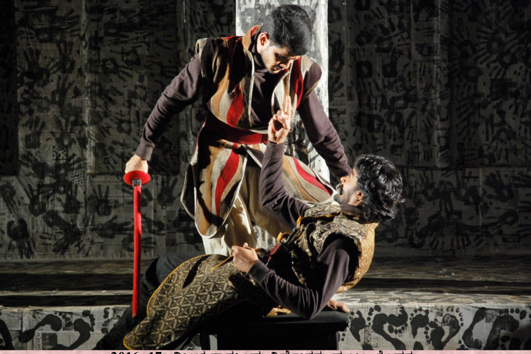
2016-17: ವಿಜಯನಾರಸಿಂಹ: ನಿರ್ದೇಶನ: ಮಂಜು ಕೊಡಗು