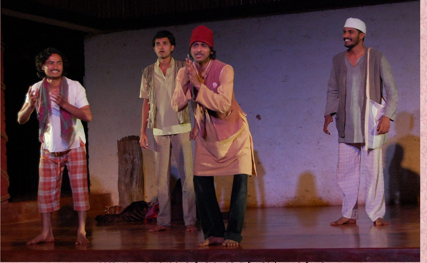
2009-10: ಎ ಮಿಡ್ ಸಮ್ ಸೈಟ್ಸ್ ಡ್ರೀಮ್: ನಿರ್ದೇಶನ: ಓಂಕಾರ್ ಕೆ.ಆರ್.