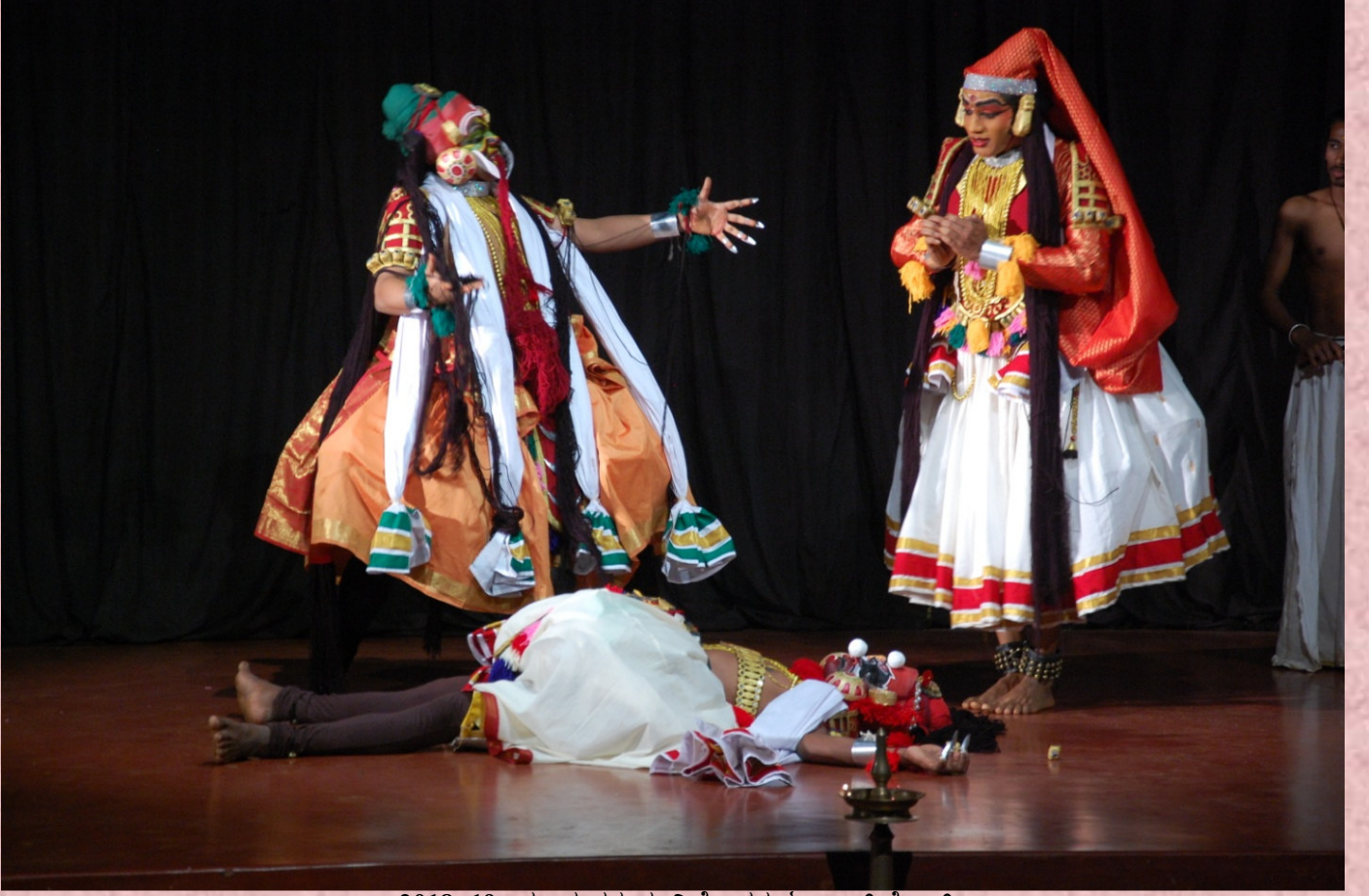
2018-19: ಮೂಕ ನರ್ತಕ: ನಿರ್ದೇಶನ: ಓಂಕಾರ್ ಕೆ.ಆರ್.