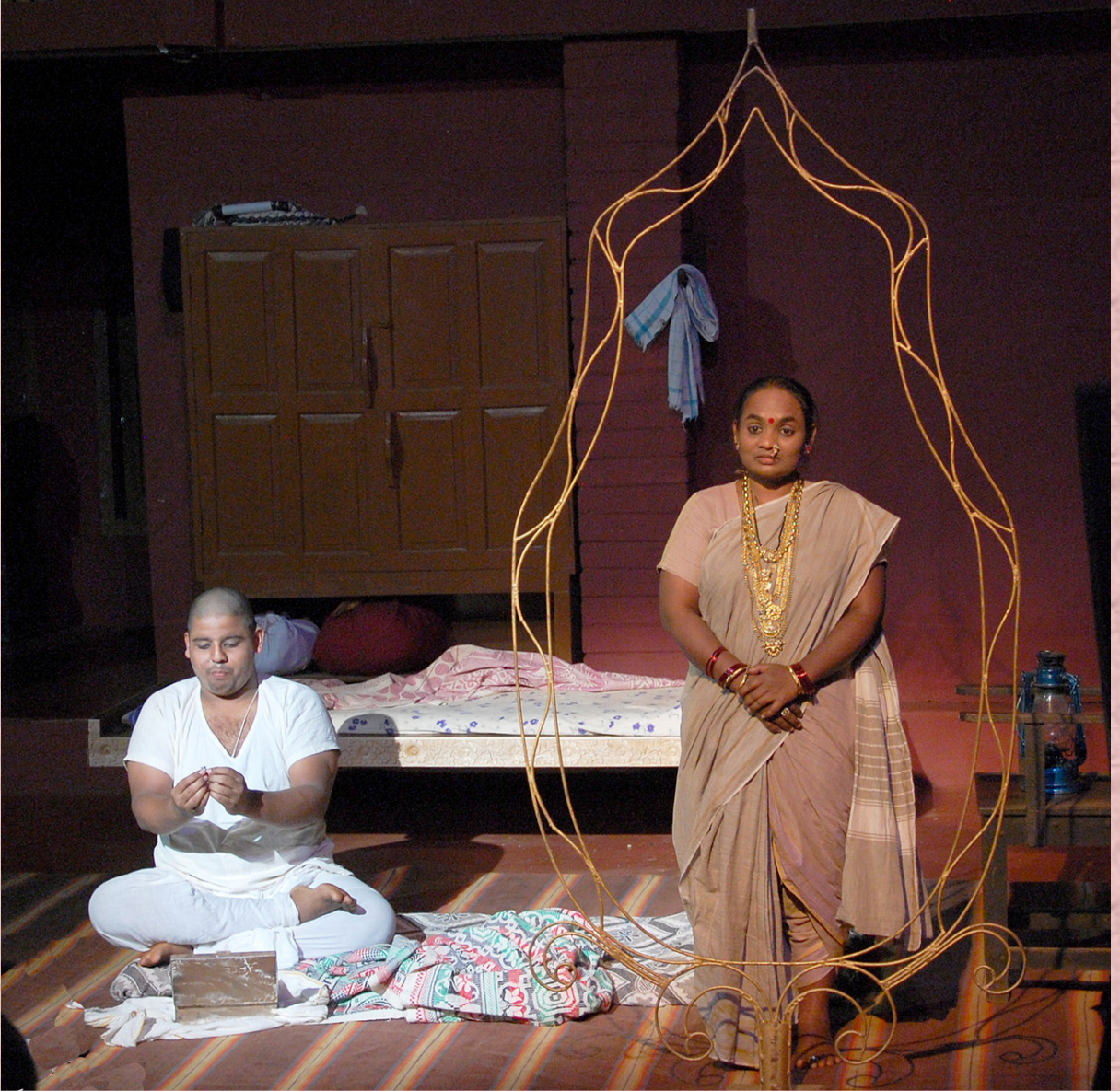
2017-18: ಚಿರೆಬಂದಿವಾಡೆ: ನಿರ್ದೇಶನ: ಪ್ರಸಾದ್ ವನಾರಸೆ