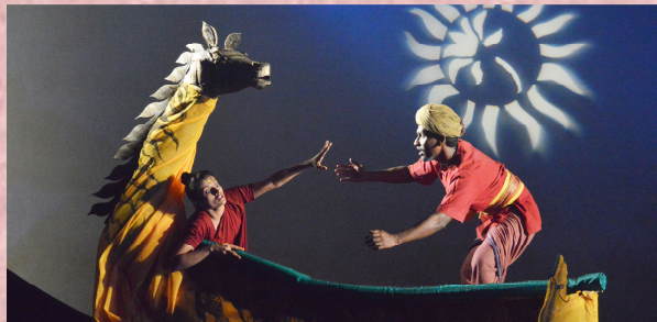
2015-16: ಪದ್ಮಗಂಧ: ನಿರ್ದೇಶನ: ಹೈಸ್ಕೂಲ್ ತೋಂಬಾ

ಕರ್ನಾಟಕ ಪ್ರೌಢ ಶಿಕ್ಷಣ ಪರೀಕ್ಷಾ ಮಂಡಳಿ, ಬೆಂಗಳೂರು.ಬಿ) ಅಲ್ಲದೆ, ಇಲ್ಲಿನ ರಂಗಶಿಕ್ಷಣ ಡಿಪ್ಲೋಮಾ ಕೋರ್ಸ್ ಎಲ್ಲಾ ರೀತಿಯಲ್ಲೂ ಸಫಲವಾಗುವಂತೆ ಸಹಕರಿಸಿದ ಅತಿಥಿ ಉಪನ್ಯಾಸಕರು, ನಿರ್ದೇಶಕರು, ರಂಗತಜ್ಞರು, ನೀನಾಸಮ್ ಬಳಗದವರು, ರಂಗತಂಡಗಳು ಮತ್ತು ಇತರ ಸಂಸ್ಥೆಗಳಿಗೂ ನೀನಾಸಮ್ ರಂಗಶಿಕ್ಷಣ ಕೇಂದ್ರವು ಋಣಿಯಾಗಿದೆ.