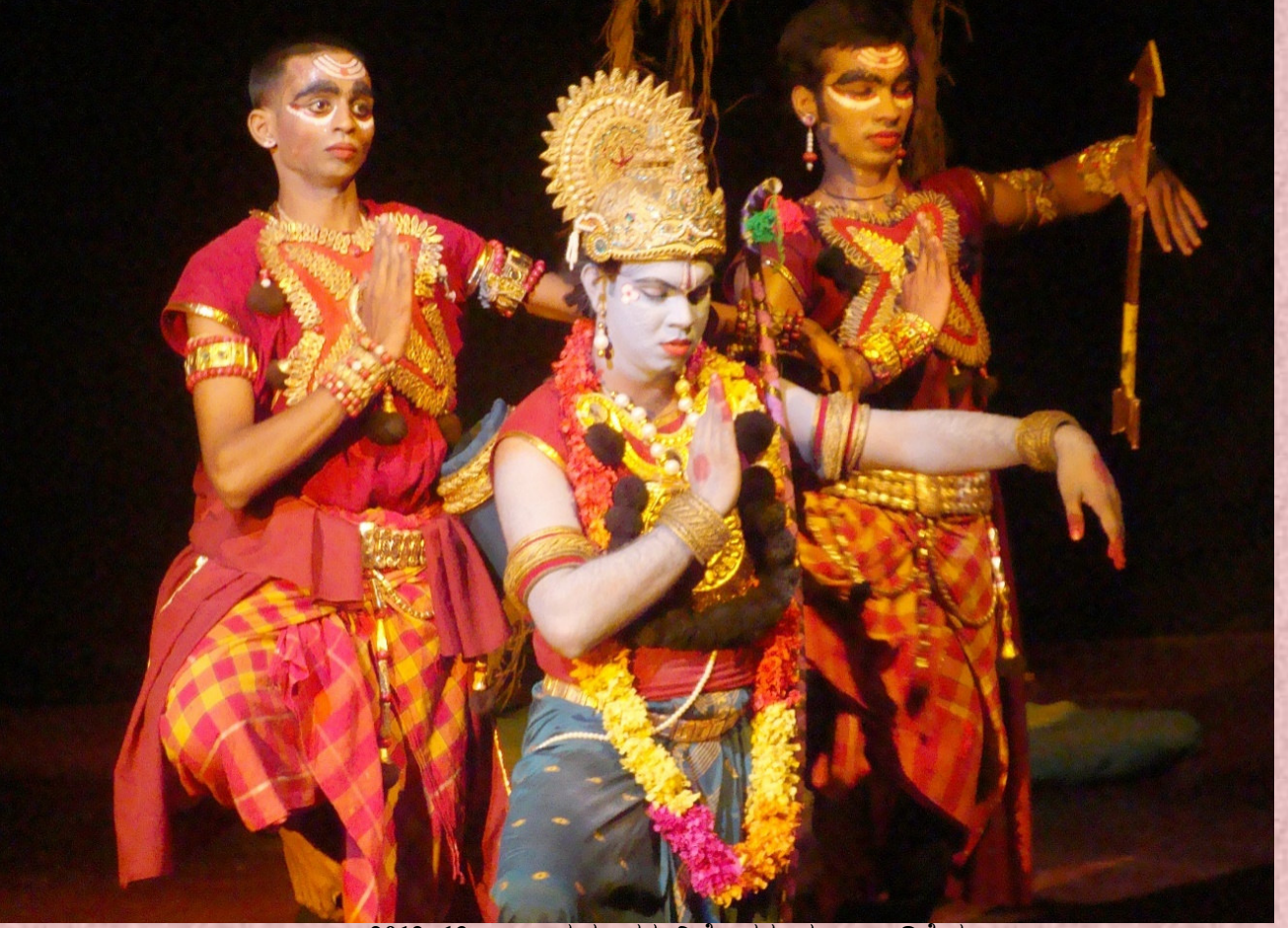
2012-13: ಸೀತಾ ಸ್ವಯಂವರ: ನಿರ್ದೇಶನ: ಮಂಜು ಬಡಿಗೇರ