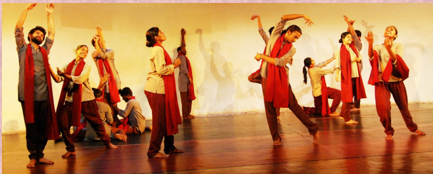
2014-15: ಕವಿತೆ ಅಂದರೆ ಏನರಿ...: ನಿರ್ದೇಶನ: ವೆಂಕಟರಮಣ ಐತಾಳ, ಅಕ್ಷರ ಕೆ.ವಿ.