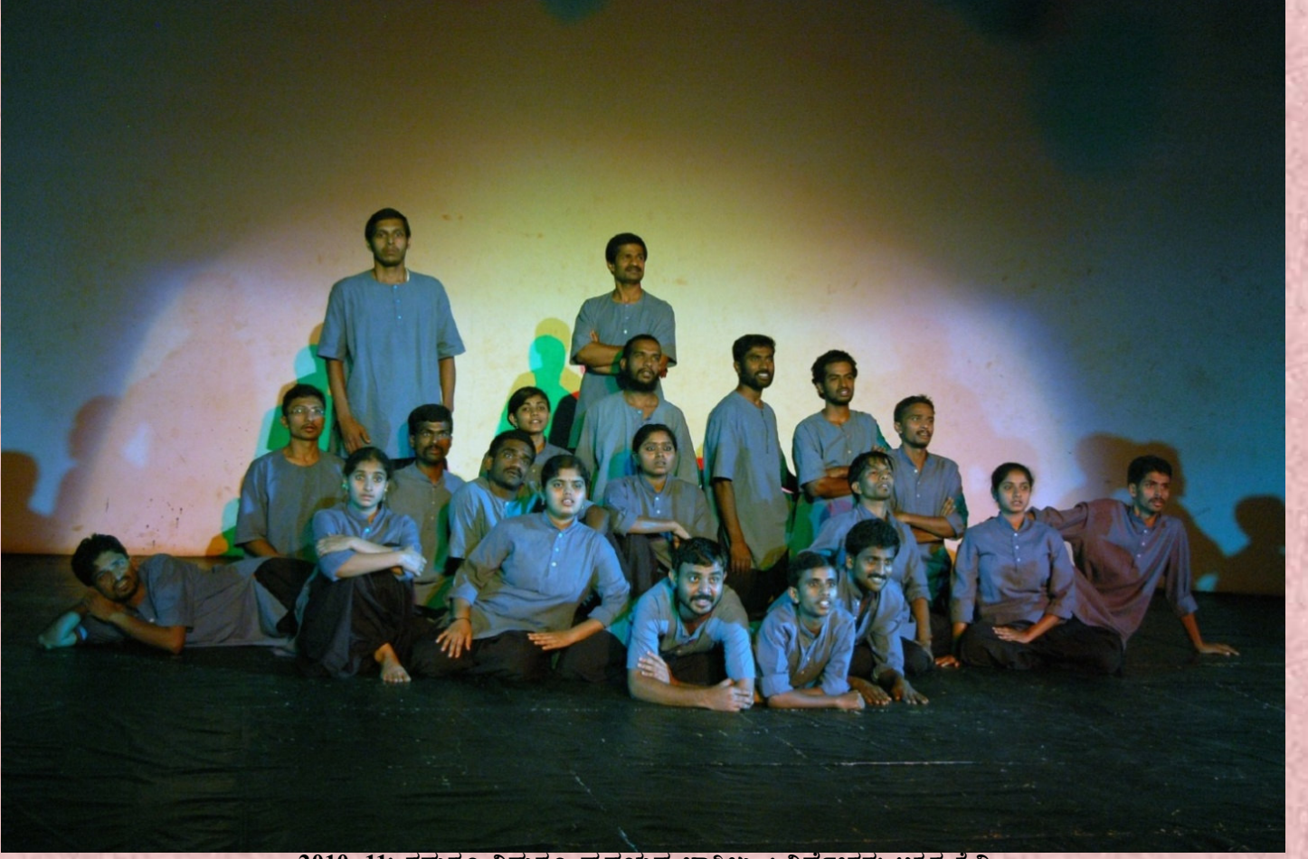
2010-11: ನಮಗೂ ನಿಮಗೂ ಹೃದಯದ ಬಾಗಿಲು...: ನಿರ್ದೇಶನ: ಅಕ್ಷರ ಕೆ.ವಿ.