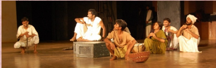
2010-11: ಸಾಂಬಶಿವ ಪ್ರಹಸನ: ನಿರ್ದೇಶನ: ಗೋಪಾಲಕೃಷ್ಣ ದೇಶಪಾಂಡೆ

ಪ್ರಸಕ್ತ ಶೈಕ್ಷಣಿಕ ವರ್ಷದಲ್ಲಿ ನೀಡಿದ ಸಹಕಾರಕ್ಕಾಗಿ ನೀನಾಸಮ್ ರಂಗಶಿಕ್ಷಣ ಕೇಂದ್ರವು ಕೆಳಗೆ ಸೂಚಿಸಿದ ಸಂಸ್ಥೆಗಳಿಗೆ ಋಣಿಯಾಗಿದೆ ಅ) ಕರ್ನಾಟಕ ಸರ್ಕಾರ, ಕನ್ನಡ ಮತ್ತು ಸಂಸ್ಕೃತಿ ಇಲಾಖೆ, ಕರ್ನಾಟಕ ನಾಟಕ ಅಕಾಡೆಮಿ, ಕೇಂದ್ರ ಸಂಗೀತ ನಾಟಕ ಅಕಾಡೆಮಿ - ನವದೆಹಲಿ, ರಾಷ್ಟ್ರೀಯ ನಾಟಕ ಶಾಲೆ - ನವದೆಹಲಿ,ರಾಷ್ಟ್ರೀಯ ನಾಟಕ ಶಾಲೆ - ಪ್ರಾದೇಶಿಕ ಸಂಪನ್ಮೂಲ ಮತ್ತು ಸಂಶೋಧನ ಕೇಂದ್ರ, ಬೆಂಗಳೂರು,ಕರ್ನಾಟಕ ಪ್ರೌಢ ಶಿಕ್ಷಣ ಪರೀಕ್ಷಾ ಮಂಡಳಿ, ಬೆಂಗಳೂರು.ಬ) ಅಲ್ಲದೆ, ಇಲ್ಲಿನ ರಂಗಶಿಕ್ಷಣ ಡಿಪ್ಲೋಮಾ ಕೋರ್ಸ್ ಎಲ್ಲಾ ರೀತಿಯಲ್ಲೂ ಸಫಲವಾಗುವಂತೆ ಸಹಕರಿಸಿದ ಅತಿಥಿ ಉಪನ್ಯಾಸಕರು, ನಿರ್ದೇಶಕರು, ರಂಗತಜ್ಞರು, ನೀನಾಸಮ್ ಬಳಗದವರು, ರಂಗತಂಡಗಳು ಮತ್ತು ಇತರ ಸಂಸ್ಥೆಗಳಿಗೂ ನೀನಾಸಮ್ ರಂಗಶಿಕ್ಷಣ ಕೇಂದ್ರವು ಋಣಿಯಾಗಿದೆ.