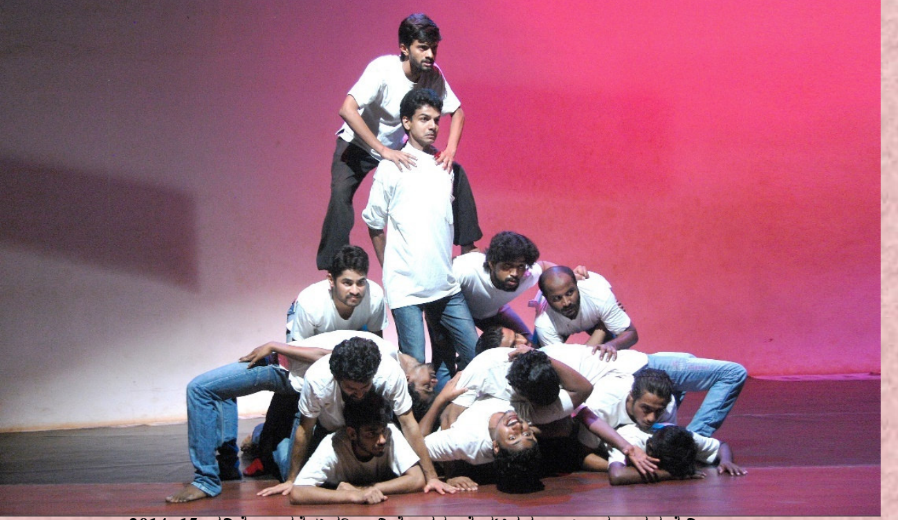
2014-15: ಕವಿತೆ ಅಂದರೆ ಏನರಿ...: ನಿರ್ದೇಶನ: ವೆಂಕಟರಮಣ ಐತಾಳ, ಅಕ್ಷರ ಕೆ.ವಿ.