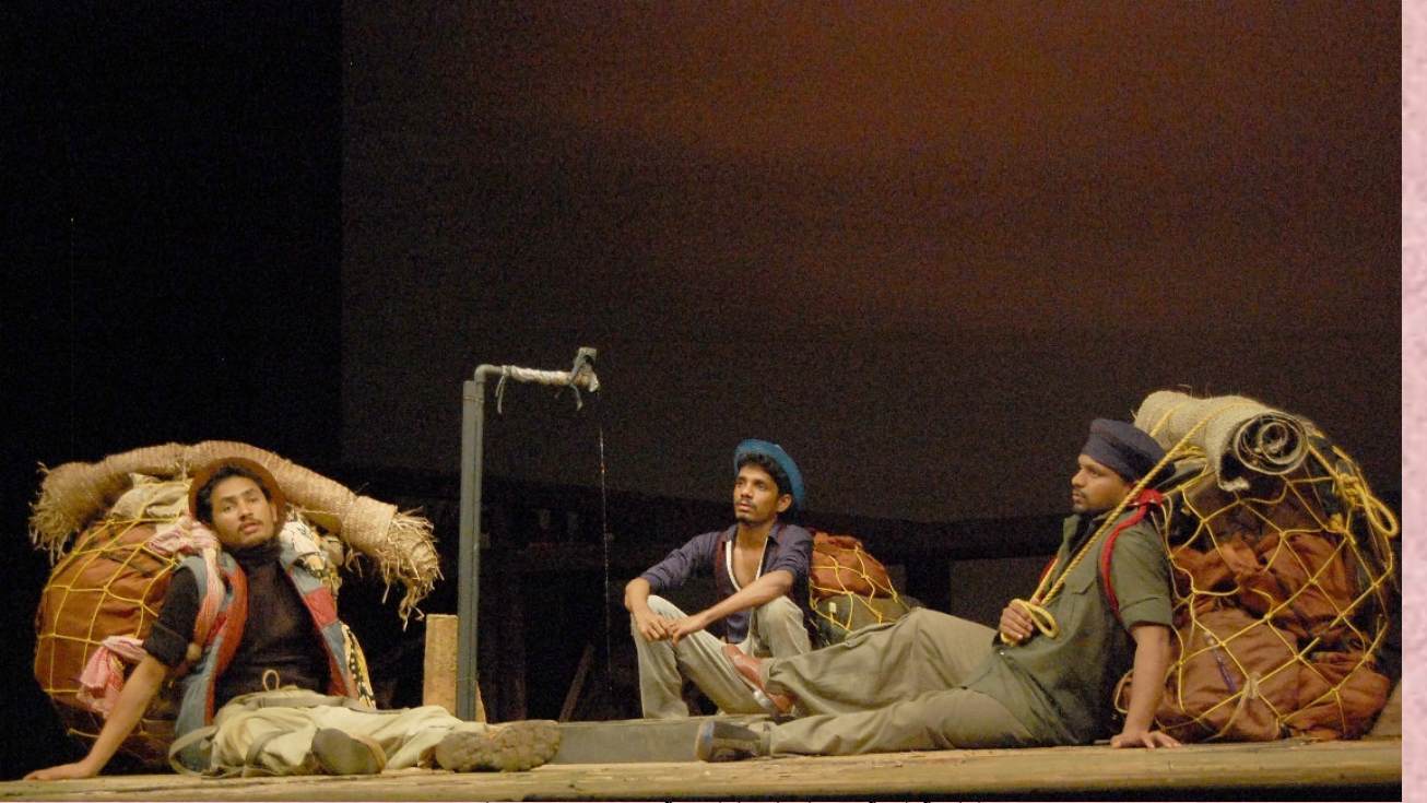
2009-10:ನೀರಿನ ನಿಲುತಾಣ: ನಿರ್ದೇಶನ: ಶಂಕರ್ ವೆಂಕಟೇಶ್ವರನ್